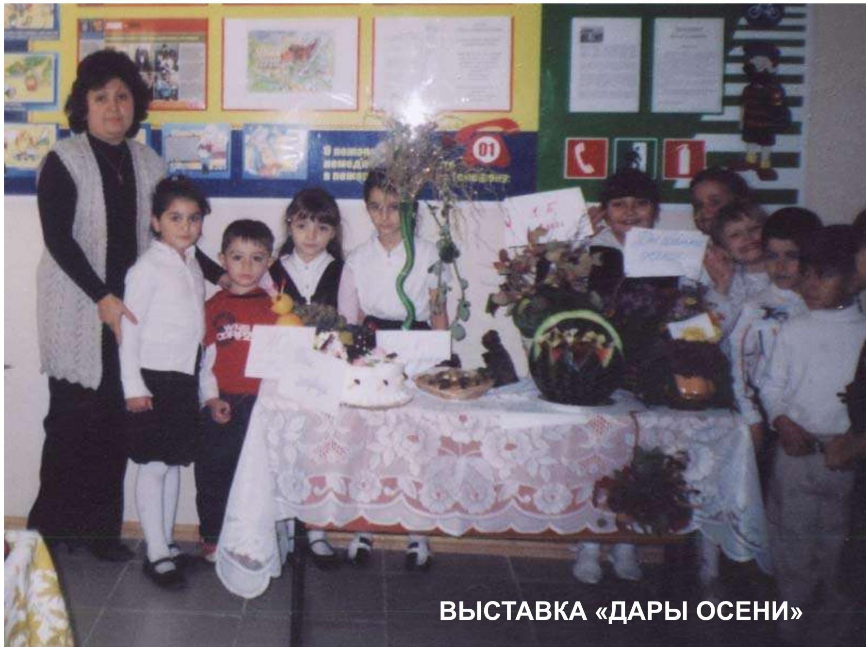
ВЫСТАВКА «ДАРЫ ОСЕНИ»